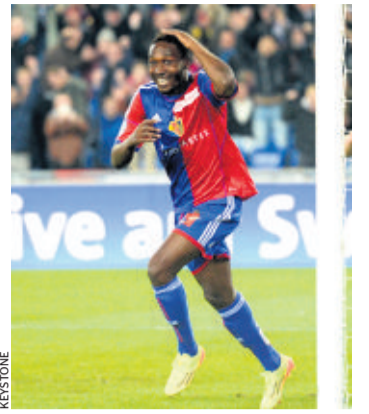
Le Bâlois Sio a inscrit un doublé.

● Union Neuchâtel a profité des meurtrissures de Fribourg Olympic pour lui subtiliser d'entrée l'avantage du parquet dans l'autre demi-finale (81-72). Comme lors de la défaite en finale de la Coupe de Suisse contre les Lions, Clinton Chapman a été bien seul à sortir la tête de l'eau du côté fribourgeois avec ses 21 points et 10 rebonds. Auteurs d'une excellente entame (16-25), les Neuchâtelois ont atteint jusqu'à 17 unités d'avance (43-60, 27e). Si l'équipe de Petar Aleksic a du cœur, comme en témoigne son retour à quatre longueurs à cinq minutes du terme (64-68), elle a toutefois pris un nouveau coup sur la tête. SI