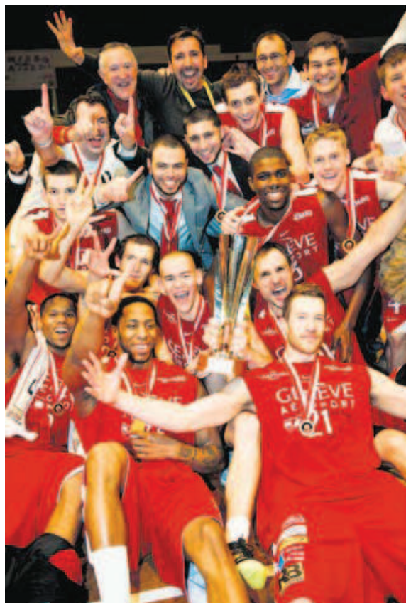
Le club a ouvert son palmarès après trois ans d'existence.

BASKETBALL. Les Lions ont disposé de Fribourg Olympic après prolongation (90-87), en finale de la Coupe de la Ligue.